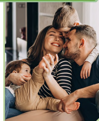
Преодоление трудной жизненной ситуации