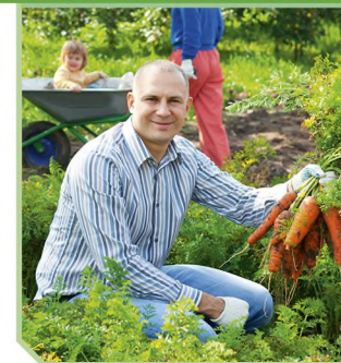
Ведение личного подсобного хозяйства